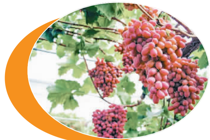
西昌克瑞森无核葡萄。