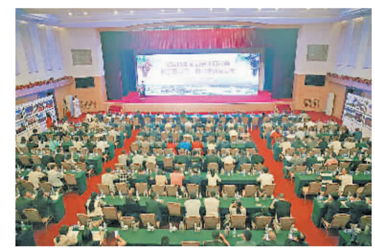
全国晚熟葡萄学术研讨会会场。

2019年10月10日上午,由中国农学会葡萄分会、西昌市人民政府主办,西昌农业投资开发有限公司、西昌葡萄协会承办的“全国晚熟葡萄学术研讨会暨首届中国·西昌晚熟葡萄节”在西昌市开幕,北京农学院、天津农学院、山东省鲜食葡萄研究所等来自全国各地农业大专院校、科研院所、葡萄