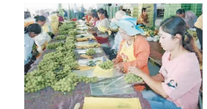
葡萄产业聚集了大量农村闲置劳动力。

西昌有文字记载的葡萄栽培历史,最早可上溯至西汉元鼎六年。在各地的葡萄酒产区中,以法国的最为著名,被称为葡萄酒王国。民国初年,法国传教士将“红八角”“牛奶”“玫瑰香”等欧洲良种葡萄传入西昌。在原西昌电厂附近,现洛古波乡,至今还在开花结果。 西昌为什么成为葡萄栽种的乐土?因为决定葡萄、葡萄酒好坏的6大因素:葡萄品种、气候、土壤、湿度、葡萄园管理和酿酒技术,无论哪一个,法国都有着最优越的条件,法国葡萄酒产量一直排在世界前茅。 这6大因素西昌全部拥有,并且还有个巨大优势,那就是土地广袤的安宁河谷——世界上最适宜优秀酿酒葡萄种生长的地方,这里的高原河谷地带还蕴藏着一条美酒带——中国